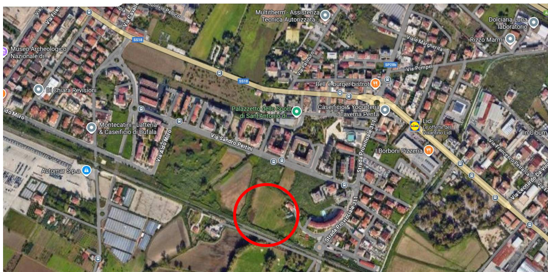
Ubicazione nuovo asilo nido

L'area adibita alla costruzione della struttura è situata a NORD della linea F.S. Salerno-Battipaglia, e fa parte di un lotto di proprietà del Comune di Pontecagnano Faiano riportato in Catasto Terreno al Foglio 7 p.lla 1808 e 3242 della sup. complessiva di 14.779 mq (cfr. Tav. 2 – inquadramento).